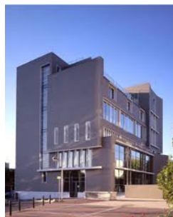
IAE (Créteil-Université) > Pour la plupart des enseignements du Master 1ère année