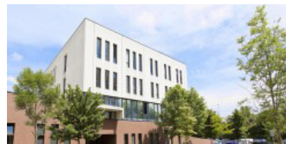
MIEE (Créteil-Université) > Pour quelques enseignements du Master 1ère année